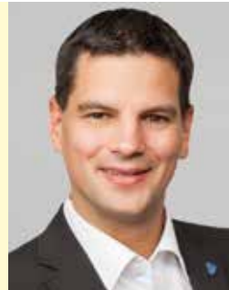
Sicherheitssprecher der FPÖ NAbg. Hannes Amesbauer