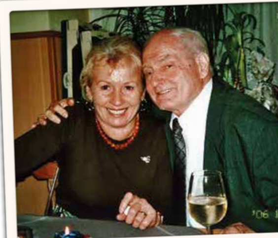
Weihnachtsfeier in Simmering 19. Dezember 2006