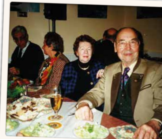
Noch einmal Weihnachten mit dem WSR im Jahre 1998