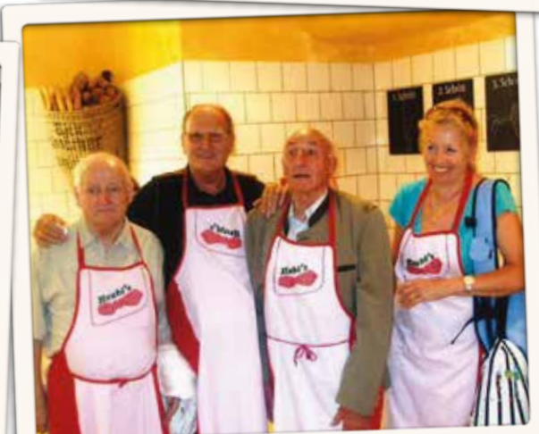
27.6.2009 – Bäckerei Hauenberger, Petzenkirchen