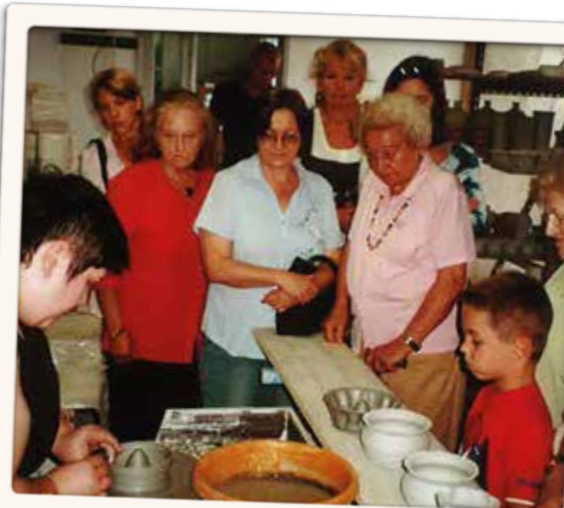
Der WSR zu Besuch der Töpferei in Stoob, 30.6.2007