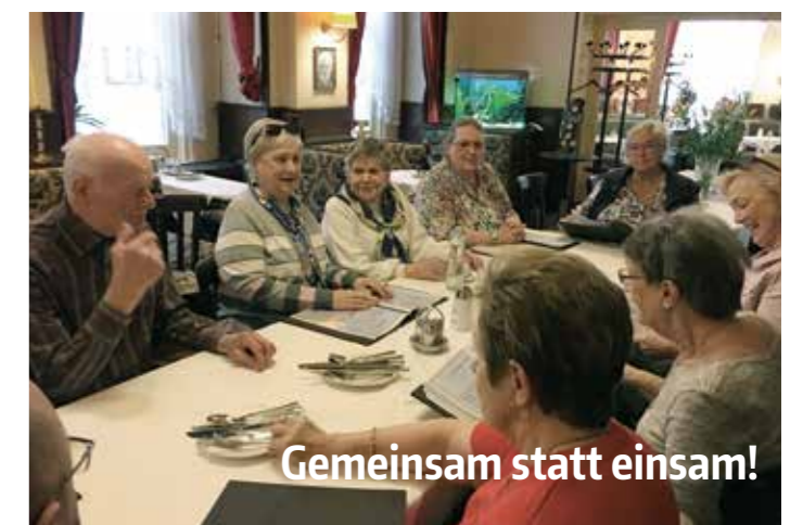
Gemeinsam statt einsam!

Aktuell unterliegen alle Treffen in gastronomischen Einrichtungen den jeweiligen Corona-Verordnungen. Wir halten uns selbstverständlich an diese Regeln. Bei Fragen wenden Sie sich bitte an die Leiterin oder den Leiter des Treffens oder an das WSR-Büro - wir geben Ihnen gerne die gewünschte Auskunft.