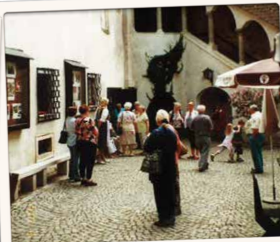
Auf der Burg Lockenhaus zu Gast am 30.6.2007