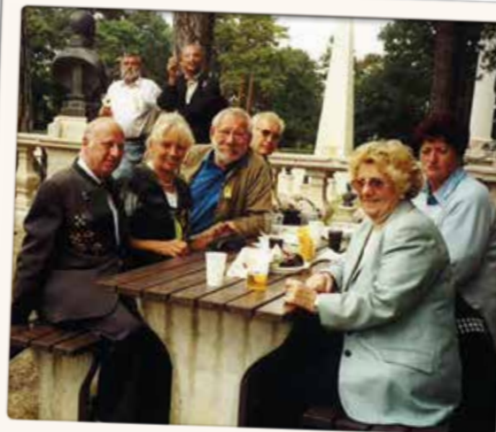
Mit dem WSR am Heldenberg im Februar 2004

Der Wiener Seniorenring bedankt sich ganz herzlich bei allen Mitgliedern, Freunden und Lesern für die zahlreichen Einsendungen ihrer Schnappschüsse, die an einige der vielen Veranstaltungen erinnern, die unter der Schirmherrschaft des Wiener Seniorenringes im Laufe seines Bestehens stattgefunden haben. Und wir wünschen Ihnen allen und uns noch unzählige Begegnungen in fröhlicher Runde!