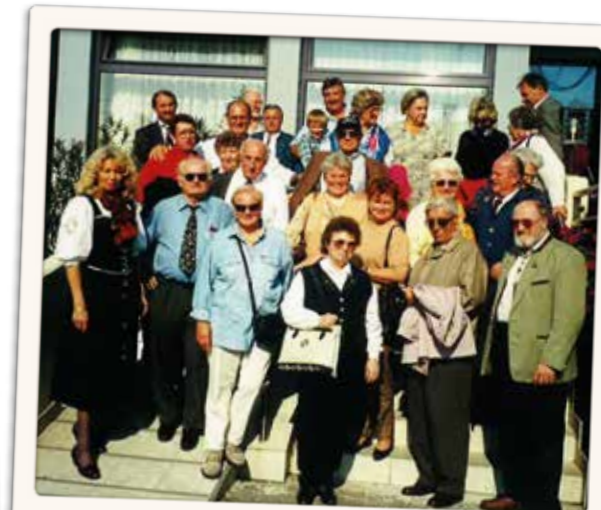
Ein Ausflug ins schöne Burgenland mit dem WSR