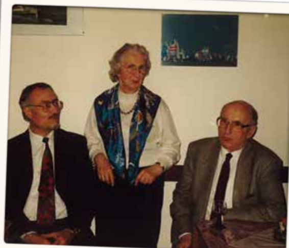
Seniorentreffen des WSR im Jahre 1995