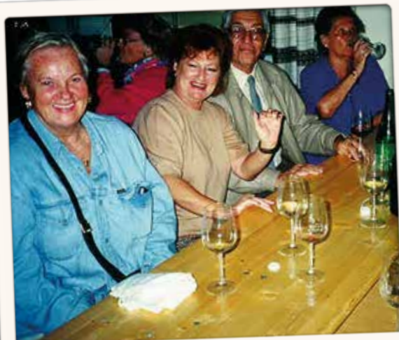
Auch da waren wir mit dem WSR im Burgenland