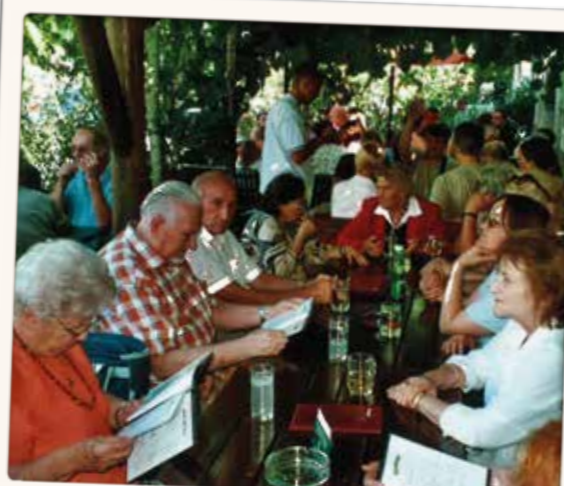
Beim Heurigen in Purbach am 30. Juni 2007