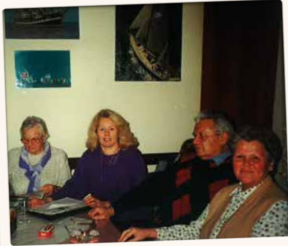
I. Seniorentreffen im Cafe Stadler am 21.2.1995