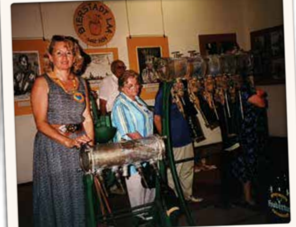
Seniorenausflug nach Laa an der Thaya im Juni 2001