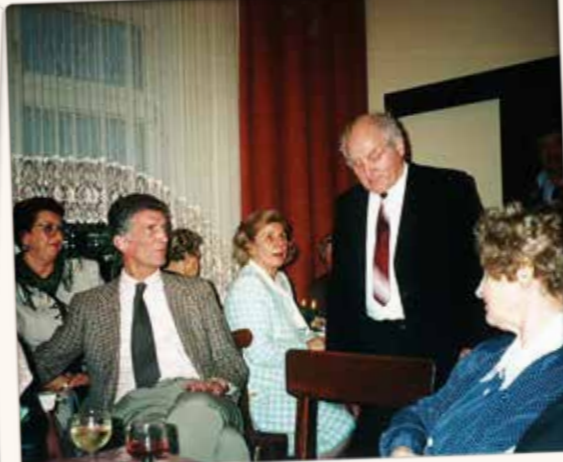
Weihnachten mit dem WSR im Jahre 1998